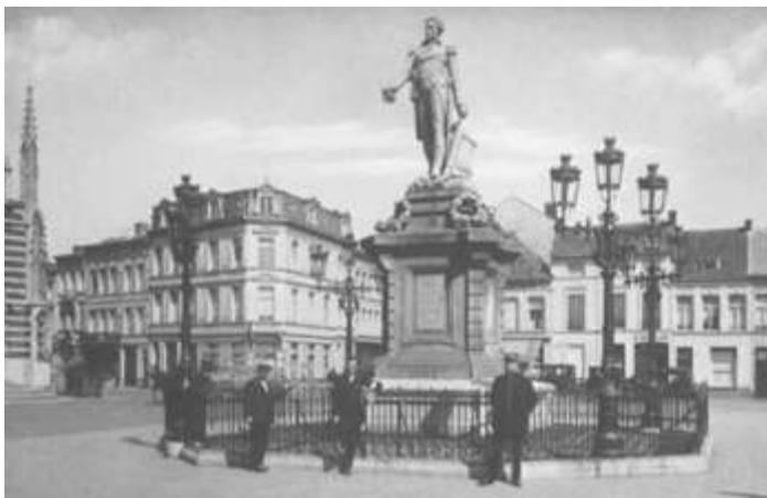
Het monument voor Carnot te Borgerhout

Ook in Antwerpen is men Carnot niet vergeten. Hij kreeg een belangrijke straat in de buurt van de Zoo naar zich genoemd, en lange tijd stond zijn standbeeld op het Laar als dank voor het sparen van Borgerhout.